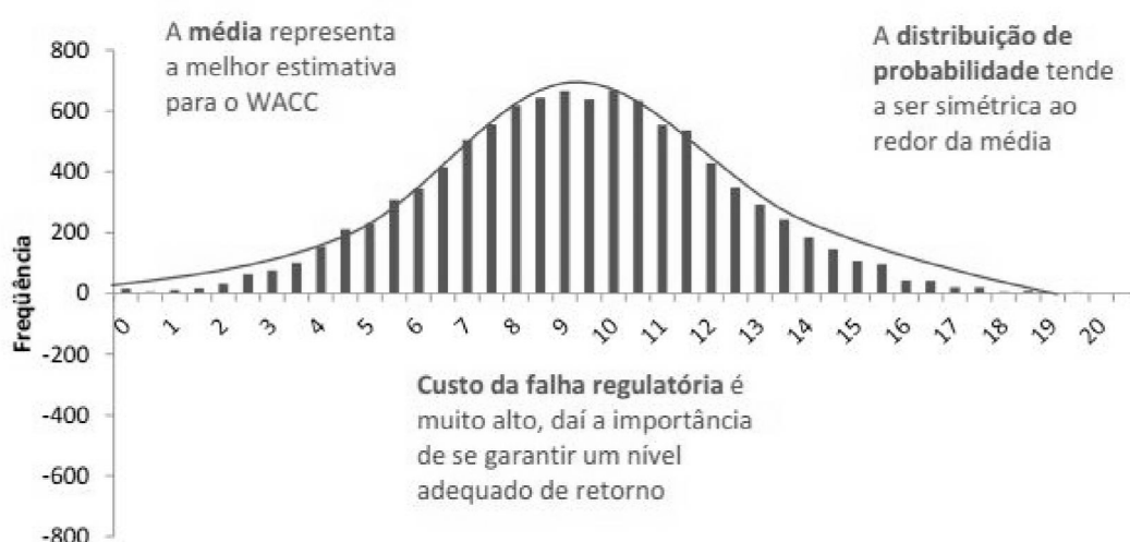
Gráfico 2: Abordagem Probabilística para o WACC

flutuação ao longo do tempo. Assim, a metodologia empregada nos garante que o WACC calculado é tão somente uma estimativa do WACC real, e que para um determinado nível de significância escolhido, há em torno do WACC calculado um intervalo simétrico no qual provavelmente se encontra o WACC real.